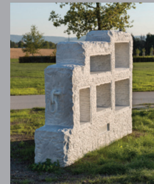
25 Markus Redl (*1977) Stein 154/129 [Regal des Archivars] Stone 154/129 [The Registrar's Shelf], 2019 Bianco Carrara Marmor/ White Carrara Marble 240 x 180 x 50 cm Sammlung Würth, Inv. 18402