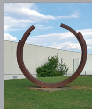
46 Bernar Venet (* 1941) 221,5° Arc x 5/ 221,5° Bogen x 5, 2003 Cortenstahl/ Corten steel Höhe/ height: 415 cm Sammlung Würth, Inv. 10883