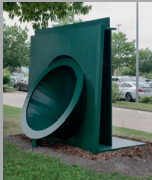
43 Anthony Caro (1924-2013) Up Front/ Vorne, 2010 Stahl/ Steel 237,5 x 259 x 173 cm Sammlung Würth, Inv. 14124