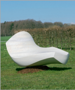
4 Tobias Ballaty (*1989) Cremona, 2022 Naxosmarmor/ Marble from Naxos 130 x 233 x 153 cm Sammlung Würth, Inv. 18814