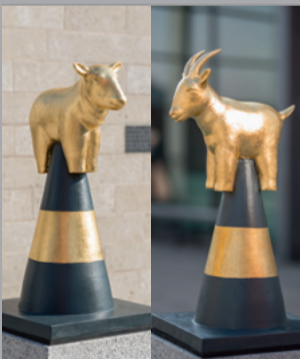
14 Heinrich Brummack (1936–2018) Wegskulptur Schaf und Ziege/ Alley Sculpture Sheep and Goat, 1998 Metall, Stein, Bronze, Blattgold, zweiteilig/ Metal, stone, bronze, beaten gold, two parts 50 x 28 x 28 cm 57 x 28 x 28 cm Sammlung Würth, Inv. 14820