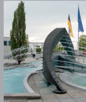
48 + 49 Robert Jacobsen (1912 - 1993) Pos. 48: Wasserrampen-Skulpturen/ Water-Ramp Sculptures, 1990 Stahl/ Steel 360 x 323 x 135 cm Sammlung Würth, Inv. 1436 Pos. 49: Delphin/ Dolphin, 1990 Stahl/ Steel 360 x 816 x 1522 cm Sammlung Würth, Inv. 1437