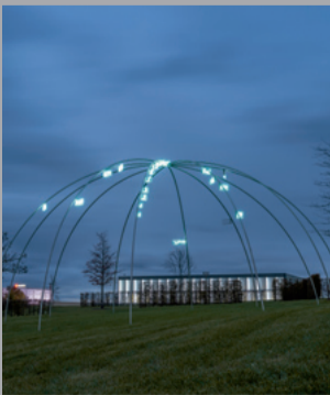
16 Mario Merz (1925–2003) Ziffern im Wald/ Numbers in the forest, 2003 Edelstahlrohre mit 21 Neonzahlen/ Stainless steel tubes with 21 neon numbers 700 x 1400 cm Sammlung Würth, Inv. 15607