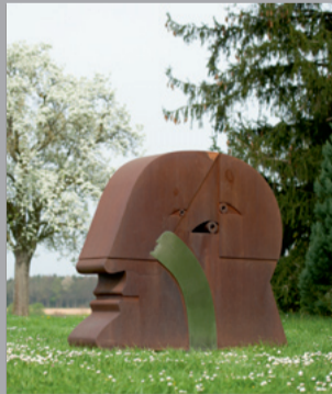
52 Horst Antes (* 1936) Kopf (Variante mit zwei Köpfen)/ Head (Variation with Two Heads), 1973 Corten- und Chrom nickelstahl/ Corten and Nickel Chromium Steel 176 x 140 x 30 cm Sammlung Würth, Inv. 1283