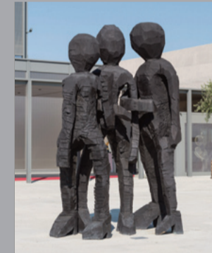
13 Georg Baselitz (*1938) BDM Gruppe/ BDM Group, 2012 Bronze, patiniert/ patinated 366 x 242 x 149 cm Sammlung Würth, Inv. 16001