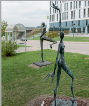
42 Helge Leiberg (* 1954) Margarita, 2010 Bronze 230 x 70 x 65 cm Sammlung Würth, Inv. 16727