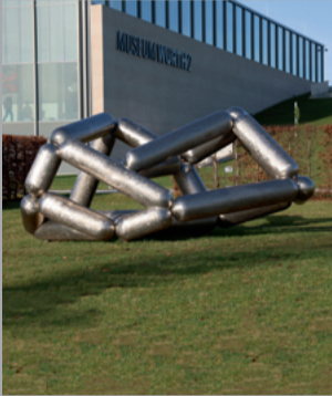
29 Richard Deacon (* 1949) Masters of the Universe: Screen Version/ Meister des Universums, Bildschirm Version, 2005 Edelstahl/ Stainless steel 172 x 393 x 295 cm Sammlung Würth, Inv. 19598