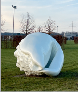
33 Marc Quinn (* 1964) Essence of the Pearl/ Das Wesen der Perle, 2022 Bronze mit Perlglanzfarbe/ Bronze with pearlescent paint, Ex. 1/3 210 x 300 x 240 cm Besitz des Künstlers/ The artist's collection