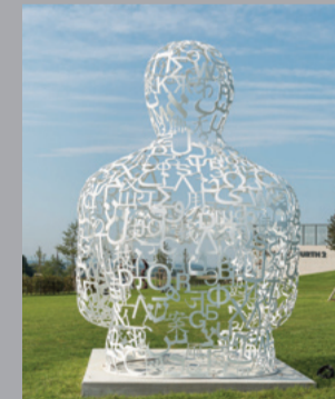
23 Jaime Plensa (*1955) WE/ Wir, 2009 Stahl, weiß lackiert/ White painted steel 500 x 340 x 360 cm Sammlung Würth, Inv. 14614