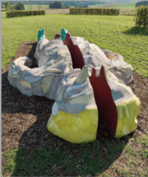
5 Alfred Hrdlicka (1928–2009) King Lear – Der geteilte Mensch/ King Lear – The divided human being, 1994 Betonguss, zweiteilig/ Concrete cast, two parts 930 x 400 x 110 cm [gesamt/total] Sammlung Würth, Inv. 4701