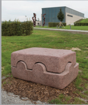
31 Eduardo Chillida (1924-2002) Harri III, 1993 Granit/ Granite 77 x 160 x 110 cm Sammlung Würth, Inv. 3520