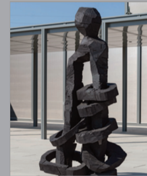
12 Georg Baselitz (*1938) Yellow Song, 2013 Bronze, patiniert/ patinated 306,5 x 146,5 x 109 cm Sammlung Würth, Inv. 16917