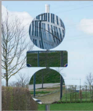
30 Elmgreen & Dragset (* 1961/1969) Adaptation Fig. 19, 2020 Edelstahl/ Stainless steel 270 x 45 x 40 cm Sammlung Würth, Inv. 18739