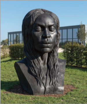
3 Helga Vockenhuber (*1963) La Nuova Eva/ Die Neue Eva/ The New Eva, 2012 Bronze 300 x 200 x 140 cm Sammlung Würth, Inv. 18126