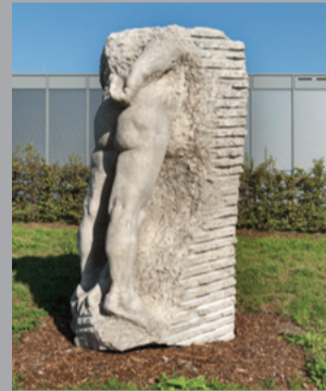
6 Alfred Hrdlicka (1928–2009) Skizze in Stein/ Sketch in Stone, 1975 Untersberger Marmor/ Marble of Untersberg Ca. 250 x 120 x 85 cm Sammlung Würth, Inv. 11744