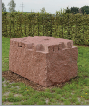
32 Eduardo Chillida (1924-2002) Instrumento para Bach/ Instrument für Bach/ Instrument for Bach, 1996 Granit/ Granite 100 x 116 x 170 cm Sammlung Würth, Inv. 3521