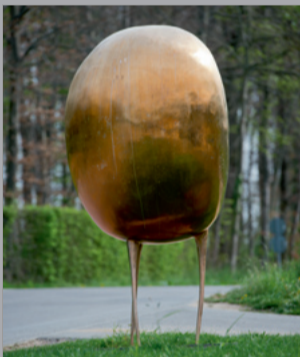
39 Alfred Haberpointner (* 1966) Gewichtung/ Ponderation, 2011 Bronze, poliert/ polished 242 x 120 x 120 cm Sammlung Würth, Inv. 15136