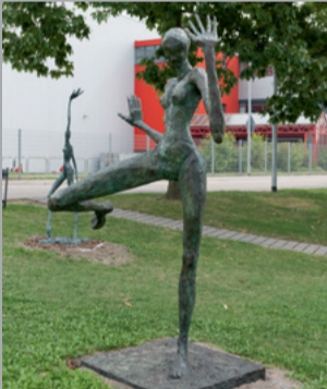
41 Helge Leiberg (* 1954) Nicht abgeneigt/ Not averse, 2004 Bronze 259 x 205 x 145 cm Sammlung Würth, Inv. 8067