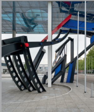
51 Robert Jacobsen (1912-1993) Der Flieger/ Aviator, 1990 Stahl/ Steel 910 x 3200 x 382 cm Sammlung Würth, Inv. 1439