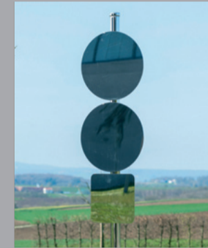
10 Elmgreen & Dragset (*1961/1969) Adaptation Fig. 2, 2018 Edelstahl/ Stainless steel 270 x 45 x 40 cm Sammlung Würth, Inv. 18737