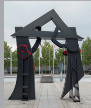
47 Robert Jacobsen (1912 - 1993) Tor/ Gate, 1990 Stahl/ Steel 500 x 429 x 180 cm Sammlung Würth, Inv. 1438