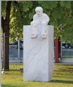
53 Markus Redl (* 1977) Stein 73/64 [Exitus]/ Stone 73/64 [Exitus], 2008 Bianco Carrara Marmor/ White Carrara Marble 300 x 100 x 105 cm Sammlung Würth, Inv. 13626