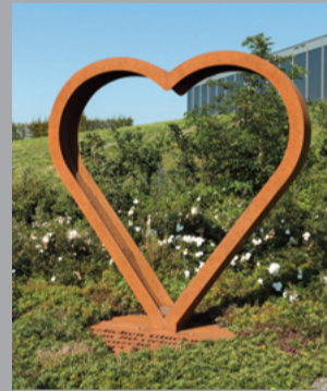
8 Ohne Titel (Herz)/ Untitled (Heart), 2017 Eisen/ Iron 366 x 242 x 149 cm Sammlung Carmen Würth, Inv. 17551