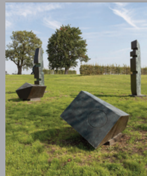
20 Barbara Hepworth (1903–1975) Conversation with Magic Stones/ Unterhaltung mit Magischen Steinen, 1973 Bronze, vierteilig/ four parts Maße variabel/ Dimensions variabel Sammlung Würth, Inv. 9060