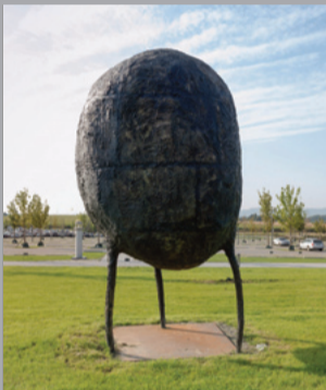
38 Alfred Haberpointner (* 1966) Gewichtung/ Ponderation, 2007 Bronze 510 x 270 x 250 cm Sammlung Würth, Inv. 10805