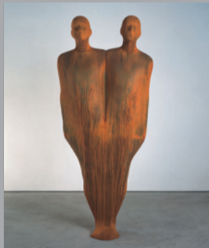
44 Antony Gormley (* 1950) Break/ Spaltung, 2002 Eisen/ Iron 193 x 87 x 32 cm Sammlung Würth, Inv. 9190