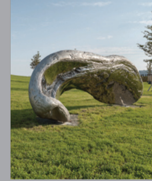
22 Marc Quinn (*1964) Frozen Wave [The Conservation of Mass]/ Gefrorene Welle [Konservierung der Masse], 2015 Edelstahl/ Stainless steel 263 x 750 x 192 cm Sammlung Würth, Inv. 18160