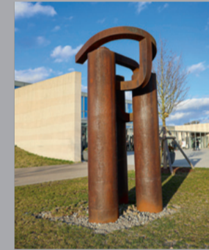
11 Eduardo Chillida (1924–2002) Basoa III/ Wald III/ Forest III, 1989 Stahl/ Steel 370 x 200 x 200 cm Sammlung Würth, Inv. 3758