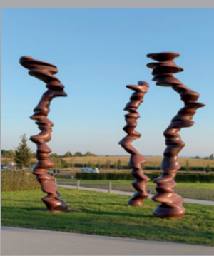
26 Tony Cragg (* 1949) Points of View/ Gesichtspunkte, 2013 Bronze, dreiteilig/ three parts 700 x 200 x 200 cm jeweils/each Sammlung Würth, Inv. 16698