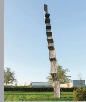
35 Magdalena Jetelová (* 1946) Treppe/ Stairs, 2010 Aluguss und Eisenbeschichtung/ Aluminium cast and iron coat 1580 x 99 x 100 cm Sammlung Würth, Inv. 13468