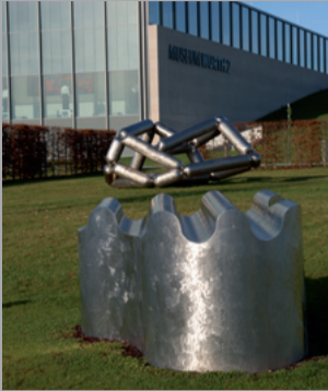
28 Richard Deacon (* 1949) Groundswell/ Dünung, 2020 Edelstahl/ Stainless Steel 90 x 280 x 172 cm Sammlung Würth, Inv. 18556