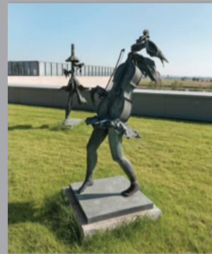
7 Ludovico de Luigi (*1933) Cellistin/ Cellist Flötenspieler/ Flutist, ohne Jahr Bronze 196 x 80 x 80 cm 226 x 100 x 100 cm Sammlung Würth, Inv. 3319, 3320