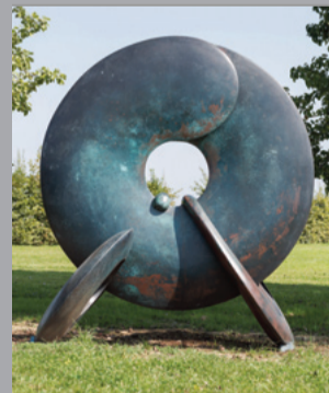
19 Lun Tsuchnowski (1946–2018) Pi, 2006 Bronze patiniert, dreiteilig/ patinated, three parts 240 x 210 x 210 cm Sammlung Würth, Inv. 11396