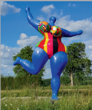
17 Niki de Saint Phalle (1930–2002) Nana dansante bleue/ Blaue tanzende Nana/ Blue Dancing Nana, 1995 Polyester, bemalt/ painted 620 x 490 x 240 cm Sammlung Würth, Inv. 17523