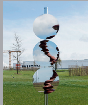
21 Elmgreen & Dragset (*1961/1969) Adaptation Fig. 16, 2020 Edelstahl/ Stainless steel 27045 x 40 cm Sammlung Würth, Inv. 18738