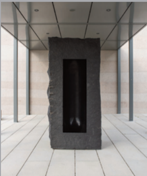
15 Anish Kapoor (*1954) Ohne Titel/ Untitled, 2004 Schwarzer Granit/ black granite 276 x 130 x 87 cm Sammlung Würth, Inv. 8616