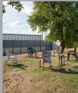
18 Lun Tsuchnowski (1946–2018) Sessel der Serie The Bub/ Armchairs of "The Bub" series, 2016–2018 diverse Materialien/ divers materials je 115 x 77 x 90 cm Sammlung Carmen Würth, Inv. 17997, 17998, 18000, 18001, 18503