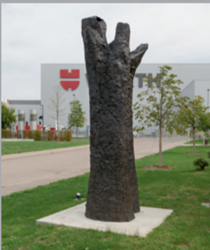
40 Magdalena Abakanowicz (1930-2017) Figura Ulima, 1999 Bronze 440 x 125 x 155 cm Sammlung Würth, Inv. 5510