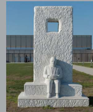
24 Markus Redl (*1977) Stein 146/122 Blickfelderweiterung/ 360° [Hold The Line] Stone 146/122 Amplification of the Visual Field/ 360°, 2016 Bianco Carrara Marmor/ White Carrara Marble 365 x 245 x 215 cm Sammlung Würth, Inv. 17280