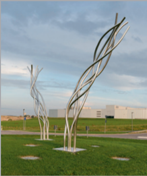
1+2 Gertrude Reum (1926–2015) Diverse Arbeiten aus Edelstahl/ Diverse Sculptures of Stainless Steel, 1992/99, 1997, 2003 Höhe/ height: 300–600 cm Pos. 1: Sammlung Würth, Inv. 16793, 17267, 17268 Pos. 2: Sammlung Würth, 4702, 4703