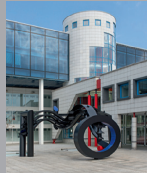
50 Robert Jacobsen (1912-1993) Skulptur vor dem Haupteingang des Verwaltungsgebäudes/ Sculpture in front of the main entrance to the administration building, 1990 Stahl/ Steel 450 x 720 x 910 cm Sammlung Würth, Inv. 1435