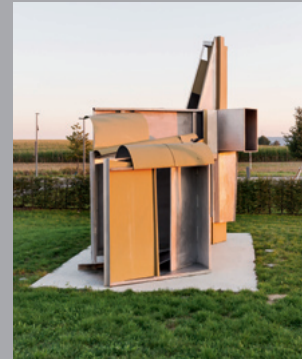
34 Anthony Caro (1924-2013) Cathedral/ Kathedrale, 1988 Edelstahl, teilweise bemalt/ Stainless Steel, partly painted 467 x 503 x 295 cm Sammlung Würth, Inv. 15513