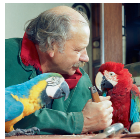
HAP Grieshaber, 1968

From this period, the Hirschwirtscheuer Künzelsau presents over 50 works by HAP Grieshaber from the Würth Collection. Since its opening in 1989, the museum has been dedicated to preserve the legacy of the artist family Sommer from Künzelsau and contrasting their work with contemporary art. This setting is particularly fitting for HAP Grieshaber's work, who consciously placed himself in the artisanal tradition of the woodcutters, transposing their art into the 20th century.