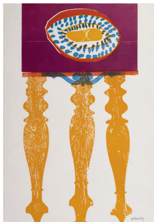
Herbstfrüchte aus der Folge: Herbst der Wilhelmstraßenkrämer, 1970 Holzschnitt: hellgelb, türkis, rot, violett, auf Büttchen Sammlung Würth, Inv. 312 Erworben 1987

As a professor at the Staatliche Akademie der Künste in Karlsruhe from 1995 to 1960, Grieshaber became an influential mentor to a young generation of contemporary artists and a