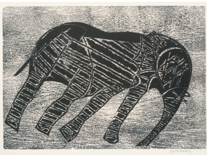
Sterbender Elefant aus der Folge: Pablo Neruda: Aufenthalt auf Erden, 1972 Holzschnitt auf Werkdruckpapier Sammlung Würth, Inv. 2109 Erworben 1993

dass dem gelernten Buchdrucker und studierten Grafiker eine grundlegende Neubestimmung des Holzschnitts gelingt. In diesem Medium kann er im Wortsinn Farbe bekennen: Schwarz oder Weiß, Sein oder Nichtsein, Materie oder Leere. Dabei knüpft er zunächst an expressionistische Traditionen des Holzschnitts an, geht aber auch weiter zurück bis zu dessen Ursprung in der altdeutschen Kunst. Grieshaber vergrößert den Holzschnitt mit handwerklicher Meisterschaft und macht ihn dem Wandbild ebenbürtig. Dabei gelingt ihm auch, dem harten, kantigen Material auch ungewohnt zarte, lyrische Töne abzurufen, ohne die das Bild des großen Holzschneiders unvollkommen wäre. Als Professor an der Staatlichen Akademie der Künste in Karlsruhe von 1955 bis 1960 wird Grieshaber zum einflussreichen Lehrer einer