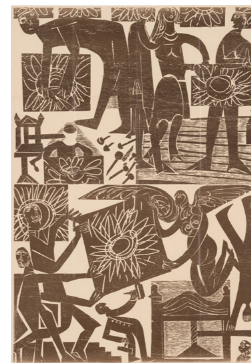
Bilderbogen „Zum Lobe der Holzschnneider“, 1965 Zwei Holzschnitte auf satiniertem Zeitungspapier, gefalzt Sammlung Würth, Inv. 9570 Erworben 2006