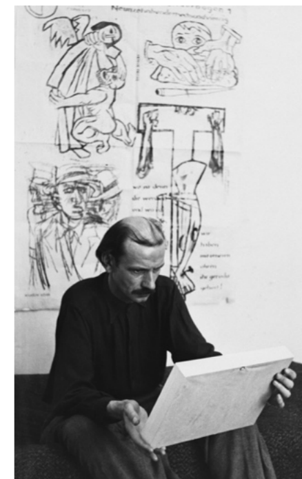
HAP Grieshaber, 1946