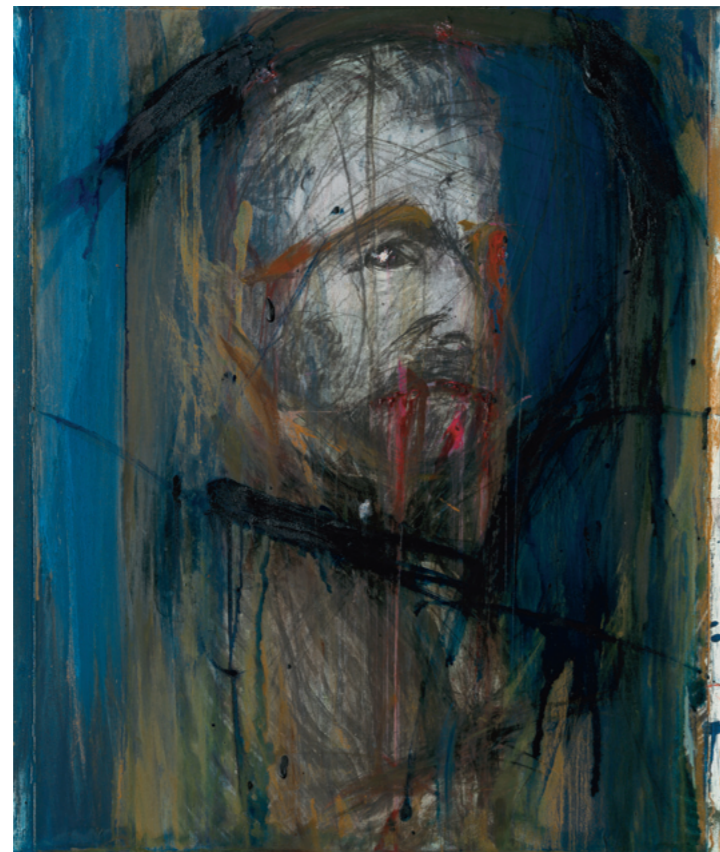
Van Gogh Übermalung / Van Gogh Overpainting 1989 Öl über Foto auf Holz / Oil on photo on wood Sammlung Würth / Würth Collection, Inv. 1797 Erworben / acquired 1992

Der österreichische Künstler Arnulf Rainer (*1929) gilt als Pionier des Informel, einer Bewegung der Malerei vornehmlich in den 1950er- und 1960er-Jahren, welche die intuitiven Ausdrucksformen der Lyrik mit den Mitteln der Abstraktion verband. Zunächst beeinflusst vom Surrealismus eines André Breton und dem Phantastischen Realismus der Wiener Schule wandte er sich vor allem der Ergründung seines eigenen Unterbewusstseins und seiner Träume mit den Möglichkeiten der Kunst zu. 1949 verlässt er aufgrund