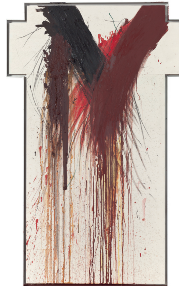
Kreuz, ohne Titel / Cross, no title 1987 Öl, Ölkreide auf Holz / Oil, oil chalk on wood Sammlung Würth / Würth Collection, Inv. 17387 Erworben / acquired 2017