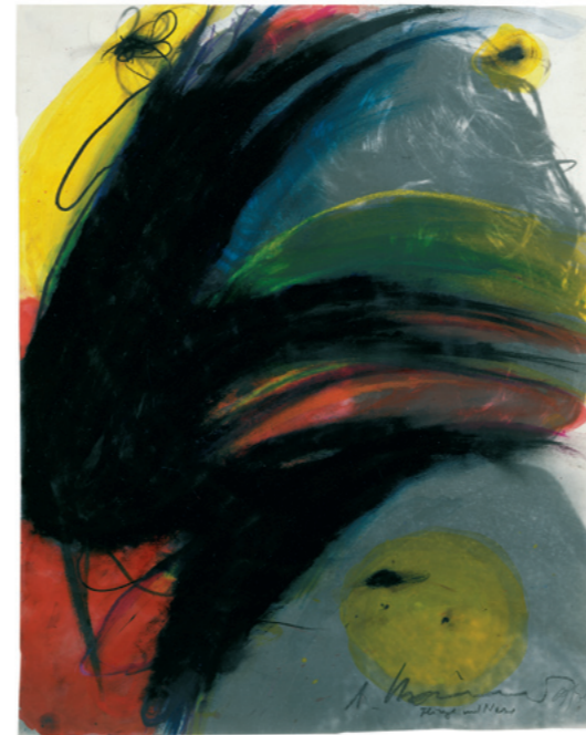
Fliege und Nase / Face Farce 1969/70 Ölkreide und Aqua- rell auf Papier (Fotoübermalung) / Oil crayon and watercolour on paper (photo overpainting) Sammlung Würth / Würth Collection, Inv. 1631 Erworben / acquired 1991

Anlässlich des 95. Geburtstags des ewig Suchenden zeigt das Museum Würth 2 eine monografische Schau und gewährt einen Überblick über das umfassende Werk, das seit vielen Jahren eine markante Position in der Sammlung Würth einnimmt. Übermalungen, Kreuze, Face Farces und Fingermalereien sind darin ebenso gut dokumentiert wie grafische Arbeiten Rainers. Die Auswahl umfasst Werke aus sechs Jahrzehnten, die aus den umfangreichen Beständen der Sammlung Würth die wichtigsten Schaffensperioden Rainers nachzeichnet.