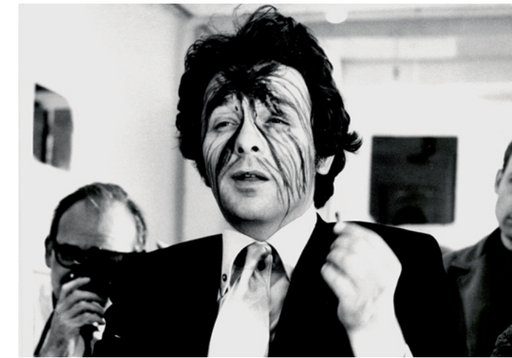
Stefan Moses Arnulf Rainer (*1929) 1967 (1994) Silbergelatineabzug / Gelatin silver print Sammlung Würth / Würth Collection, Inv. 19382 Erworben / acquired 2023