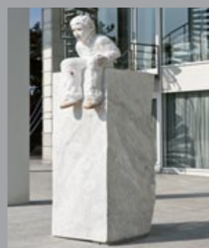
52 Markus Redl (*1977) Stein 73/64 [Exitus] / Stone 73/64 [Exitus], 2008 Bianco Carrara Marmor / White Carrara Marble 300 x 100 x 105 cm Sammlung Würth, Inv. 13626