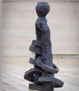
10 Georg Baselitz (*1938) Yellow Song, 2013 Bronze, patiniert / patinated 306,5 x 146,5 x 109 cm Sammlung Würth, Inv. 16917