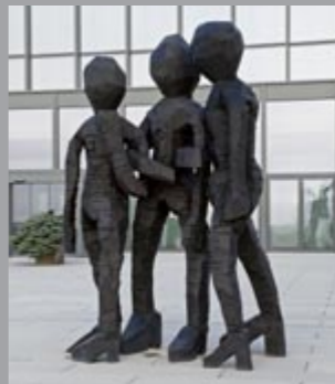
11 Georg Baselitz (*1938) BDM Gruppe / BDM Group, 2012 Bronze, patiniert / patinated 366 x 242 x 149 cm Sammlung Würth, Inv. 16001 ☞ 216