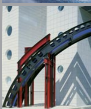
48 Robert Jacobsen (1912-1993) Der Flieger / Aviator, 1990 Stahl/Steel 910 x 3200 x 382 cm Sammlung Würth, Inv. 1439 🔊 201