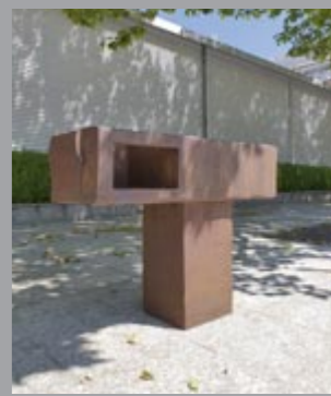
50 Eduardo Chillida (1924-2002) Gora Bera IV / Oben Unten IV / Above Below IV, 1993 Stahl / Steel 91 x 124 x 49 cm Sammlung Würth, Inv. 3518