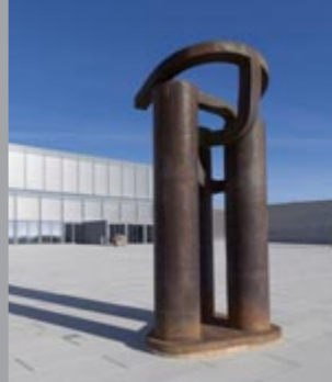
9 Eduardo Chillida (1924–2002) Basoa III / Wald III / Forest III, 1989 Stahl/Steel 370 x 200 x 200 cm Sammlung Würth, Inv. 3758 ☞ 205