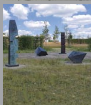
19 Barbara Hepworth (1903–1975) Conversation with Magic Stones / Unterhaltung mit Magischen Steinen, 1973 Bronze, vierteilig / four parts Maße variabel / Dimensions variabel Sammlung Würth, Inv. 9060 ☞ 209