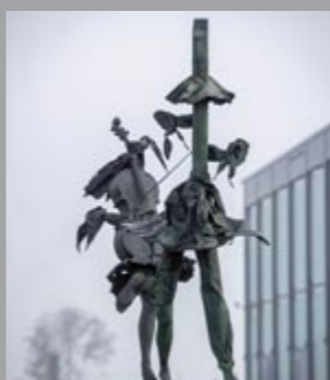
6 Ludovico de Luigi (*1933) Cellistin / Cellist Flötenspieler / Flutist ohne Jahr Bronze 196 x 80 x 80 cm 226 x 100 x 100 cm Sammlung Würth, Inv. 3319, 3320