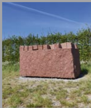
27 Eduardo Chillida (1924-2002) Instrumento para Bach / Instrument for Bach, 1996 Granit/ Granite 100 x 116 x 170 cm Sammlung Würth, Inv. 3521 🔊 222