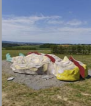
4 Alfred Hrdlicka (1928–2009) King Lear – Der geteilte Mensch / King Lear – The divided human being, 1994 Betonguss, zweiteilig / Concrete cast, two parts 930 x 400 x 110 cm (gesamt/total) Sammlung Würth, Inv. 4701 ☞ 206