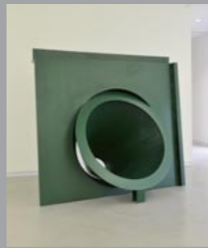
39 Anthony Caro (1924-2013) Up Front / Vorne, 2010 Stahl / Steel 237,5 x 259 x 173 cm Sammlung Würth, Inv. 14124