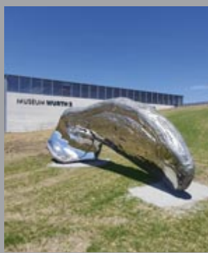
20 Marc Quinn (*1964) Frozen Wave [The Conservation of Mass] / Gefrorene Welle (Konservierung der Masse), 2015 Edelstahl / Stainless steel 263 x 750 x 192 cm Sammlung Würth, Inv. 18160 🔊 221