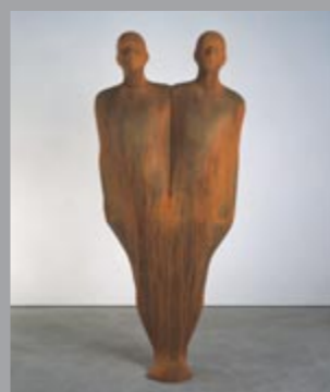
40 Antony Gormley (*1950) Break / Spaltung, 2002 Eisen / Iron 193 x 87 x 32 cm Sammlung Würth, Inv. 9190