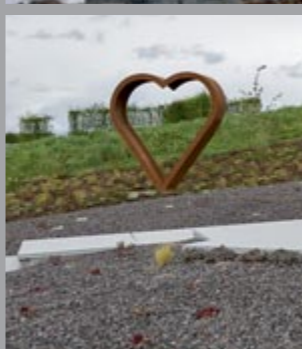
7 Ohne Titel (Herz) / Untitled (Heart), 2017 Eisen / Iron 366 x 242 x 149 cm Sammlung Carmen Würth, Inv. 17551