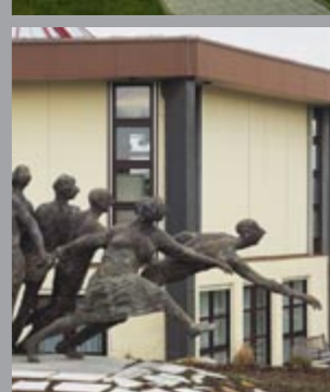
55 Karl-Henning Seemann (*1934) Impuls, 1992/1994 Bronze 260 x 480 x 150 cm Sammlung Würth, Inv. 1880