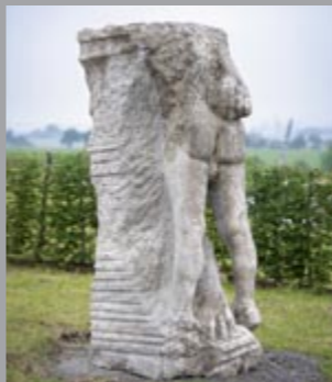
5 Alfred Hrdlicka (1928–2009) Skizze in Stein / Sketch in Stone, 1975 Untersberger Marmor / Marble of Untersberg Ca. 250 x 120 x 85 cm Sammlung Würth, Inv. 11744