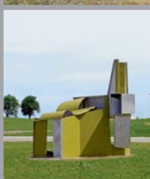
30 Anthony Caro (1924-2013) Cathedral / Kathedrale, 1988 Edelstahl, teilweise bemalt / Stainless Steel, partly painted 467 x 503 x 295 cm Sammlung Würth, Inv. 15513 🔊 215