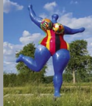
15 Niki de Saint Phalle (1930–2002) Nana dansante bleue / Blaue tanzende Nana / Blue Dancing Nana, 1995 Polyester, bemalt / painted 620 x 490 x 240 cm Sammlung Würth, Inv. 17523 ☞ 220