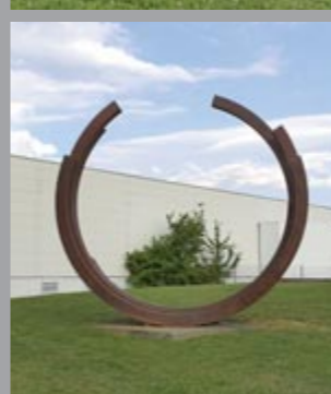
42 Bernar Venet (*1941) 221,5° Arc x 5 / 221,5° Bogen x 5, 2003 Cortenstahl / Corten steel Höhe/height: 415 cm Sammlung Würth, Inv. 10883 🔊 211