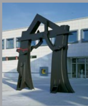
44 Robert Jacobsen (1912-1993) Tor / Gate, 1990 Stahl / Steel 500 x 429 x 180 cm Sammlung Würth, Inv. 1438 🔊 201