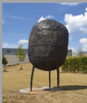
34 Alfred Haberpointner (*1966) Gewichtung / Ponderation, 2007 Bronze 510 x 270 x 250 cm Sammlung Würth, Inv. 10805 🔊 210