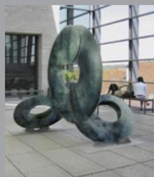
18 Lun Tsuchnowski (1946–2018) Pi, 2006 Bronze patiniert, dreiteilig / patinated, three parts 240 x 210 x 210 cm Sammlung Würth, Inv. 11396 ☞ 212