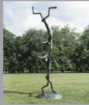
14 Barry Flanagan (1941–2009) Acrobats / Akrobaten, 1997 Bronze 443 x 165 x 125 cm Sammlung Würth, Inv. 8612 ☞ 208