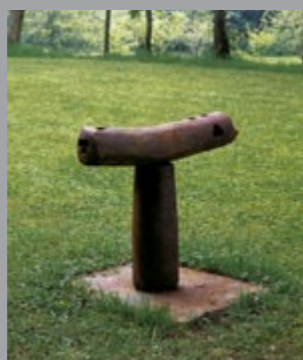
28 Eduardo Chillida (1924-2002) Saludo a los pajaros / Gruß an die Vögel / Greeting to the Birds, 1994 Stahl / Steel 107 x 91 x 24 cm Sammlung Würth, Inv. 3522