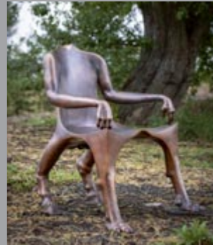
16 Lun Tsuchnowski (1946–2018) Sessel / Armchair, 2018 Bronze 115 x 77 x 90 cm Sammlung Carmen Würth, Inv. 18000