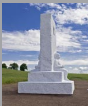
23 Markus Redl (*1977) Stein 154/129 [Regal des Archivars] Stone 154/129 [The Registrar's Shelf], 2019 Bianco Carrara Marmor / White Carrara Marble 240 x 180 x 50 cm Sammlung Würth, Inv. 18402