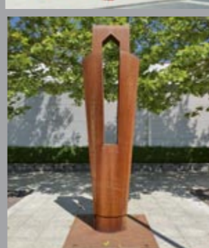
49 Werner Pokorny (*1949) Gefäß + Haus, durchbrochen / Vessel and House, cut through, 2004 Cortenstahl / Corten Steel 380 x 150 x 154 cm Sammlung Würth, Inv. 13665