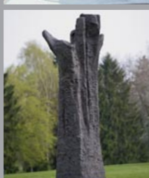
36 Magdalena Abakanowicz (1930-2017) Figura Ultima 1999 Bronze 440 x 125 x 155 cm Sammlung Würth, Inv. 5510