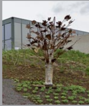
8 Christiane Bürkert Leben-Herz-Baum / Life-Heart-Tree, 2017 Eisen, Holz / Iron, wood 300 x 150 x 150 cm Sammlung Carmen Würth, Inv. 17549