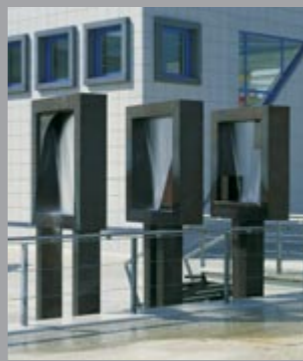
45 Robert Jacobsen (1912-1993) Wasserrampen-Skulpturen / Water-Ramp Sculptures, 1990 Stahl/Steel 360 x 323 x 135 cm Sammlung Würth, Inv. 1436 🔊 201