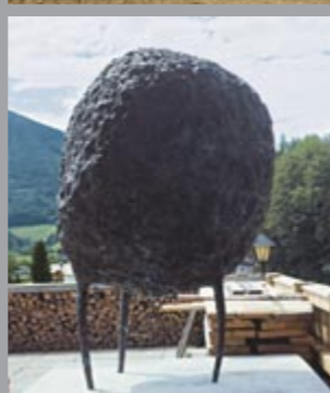
35 Alfred Haberpointner (*1966) Gewichtung / Ponderation, 2002 Bronze 220 x 150 x 150 cm Sammlung Würth, Inv. 7606