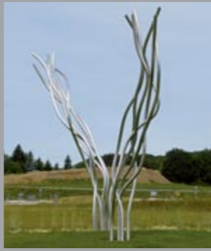
1+2 Gertrude Reum (1926–2015) Diverse Arbeiten aus Edelstahl / Diverse Sculptures of Stainless Steel, 1992/99, 1997, 2003 Höhe / height: 300–600 cm Pos. 1: Sammlung Würth, Inv. 16793, 17267, 17268 Pos. 2: Sammlung Würth, 4702, 4703