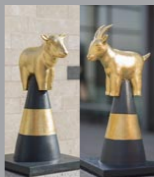
12 Heinrich Brummack (1936–2018) Wegskulptur Schaf und Ziege / Alley Sculpture Sheep and Goat, 1998 Metall, Stein, Bronze, Blattgold, zweiteilig Metal, stone, bronze, beaten gold, two parts Schaf/sheep: 50 x 28 x 28 cm Ziege/goat: 57 x 28 x 28 cm Sammlung Würth, Inv. 14820