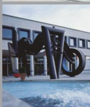
47 Robert Jacobsen (1912-1993) Skulptur vor dem Haupt- eingang des Verwaltungsgebäudes/ Sculpture in front of the main entrance to the administration building, 1990 Stahl/Steel 450 x 720 x 910 cm Sammlung Würth, Inv. 1435 🔊 201