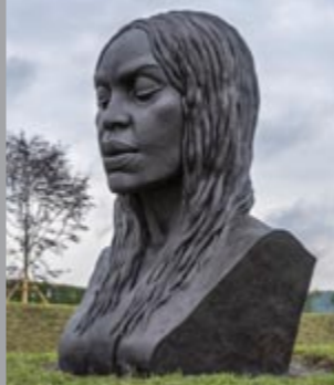
3 Helga Vockenhuber (*1963) La Nuova Eva / Die Neue Eva / The New Eva, 2012 Bronze 300 x 200 x 140 cm Sammlung Würth, Inv. 18126