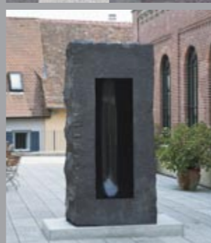
13 Anish Kapoor (*1954) Untitled, 2004 Schwarzer Granit / black granite 276 x 130 x 87 cm Sammlung Würth, Inv. 8616