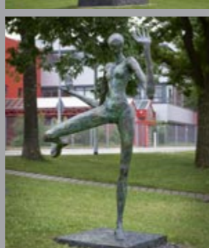
37 Helge Leiberger (*1954) Nicht abgeneigt / Not averse, 2004 Bronze 259 x 205 x 145 cm Sammlung Würth, Inv. 8067