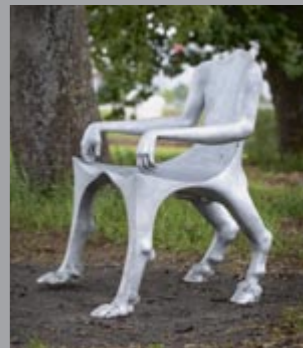
17 Lun Tsuchnowski (1946–2018) The Bub-Alloyman, 2018 Aluminiumguss / aluminium cast 115 x 77 x 90 cm Sammlung Carmen Würth, Inv. 18001