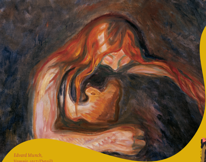
Edvard Munch, Vampir, 1917 (Detail) Öl auf Leinwand, 85 x 110 cm Sammlung Würth, Inv. 6090