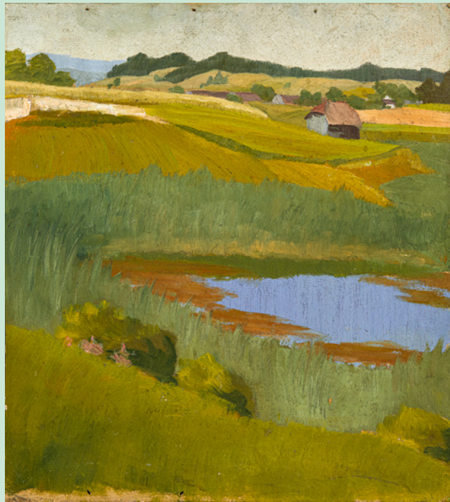
Emil Nolde, "Weiher" / Pond, 1898, Öl auf Malpappe / Oil on cardboard, 40 x 35,5 cm, Nolde Stiftung Seebüll