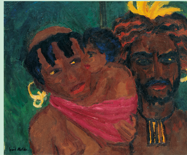
Emil Nolde, "Papuafamilie" / Papuan Family, 1914, Öl auf Leinwand / Oil on canvas, 73 x 88,5 cm, Nolde Stiftung Seebüll