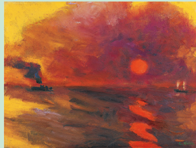
Emil Nolde, "Sonnenuntergang" / Sunset, 1948, Öl auf Leinwand / Oil on canvas, 67 x 88 cm, Nolde Stiftung Seebüll