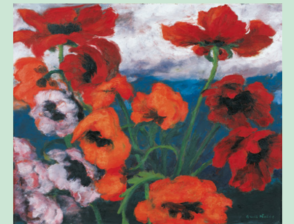
Emil Nolde, "Großer Mohn" (rot, rot, rot) / Large Poppies (Red, Red, Red), 1942, Öl auf Leinwand / Oil on canvas, 73,5 x 89,5 cm, Nolde Stiftung Seebüll

With stupendously intensive and authentic narrative talent, Nolde reaches astonishingly cosmopolitan and yet unmistakable pictorial worlds, which, contrary to his disturbing political conviction, easily overcome artistic conventions and cultural boundaries.