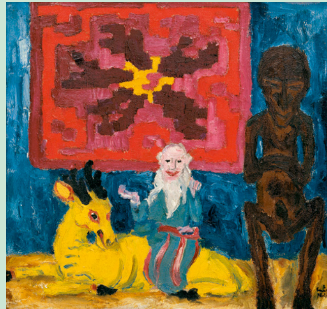
Emil Nolde, "Stilleben E" (Hirschgruppe, Kissen, Tambour) / Still Life E (Group of Deer, Pillow, Tambour), 1914, Öl auf Leinwand / Oil on canvas, 72,5 x 77 cm, Sammlung Würth, Inv. 4194