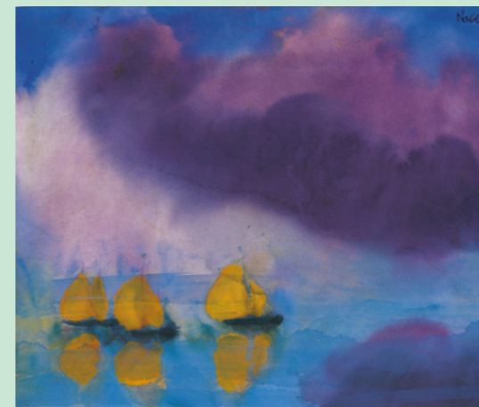
Emil Nolde, Meer (mit violetten Wolken) und drei gelben Seglern / Sea (with purple clouds) and three yellow sailors, Aquarell / watercolour, 23 x 27,1 cm, Nolde Stiftung Seebüll

Mit der stupenden Intensität und Originalität seines erzählerischen Talents gelang es Nolde, erstaunlich kosmopolitische und doch unverwechselbare Bildwelten hervorzubringen, die entgegen seiner verstörenden politischen Gesinnung malerische Konventionen und kulturelle Grenzen mühelos überwinden.