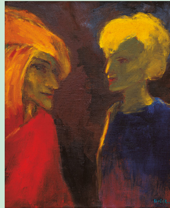
Emil Nolde, "Lichtzauber" / Magic of Light, 1947, Öl auf Leinwand / Oil on canvas, 69,5 x 56 cm, Sammlung Würth, Inv. 5846