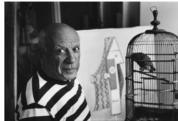
René Burri, Pablo Picasso, 1957 (2003/2004) Silbergelatineabzug / Gelatin silver print Sammlung Würth, Inv. 18962

and are complexly planned. Yet they are still authentic. For it is the oscillation between intimacy and calculated distance that creates the sophistication that lends these images on display their special magic.