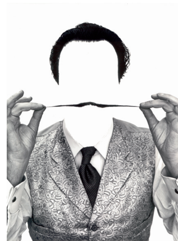
Philippe Halsman, Salvador Dalí, 1954 (ca. 1981) Silbergelatineabzug / Gelatin silver print, Sammlung Würth, Inv. 19242, © Philippe Halsman / Magnum Photos

diese Bildnisgalerie zudem, wie souverän sich die vergleichsweise junge Disziplin der Fotografie im Laufe des 20. Jahrhunderts mit ihrer künstlerisch wie technisch vielgestaltigen Bildsprache als eigenständige Kunstform emanzipiert hat. Der genuin fotografische Prozess aus Belichten und Entwickeln wurde längst in weit über das Technische hinausgehender Konnotation umgedeutet. In ihren Werken porträtieren die Fotografinnen und Fotografen ihre Gegenüber (auch aus den eigenen Reihen) auf Augenhöhe. Viele Aufnahmen erscheinen dokumentarisch und sind doch aufwendig inszeniert. Authentisch sind sie dennoch. Denn es ist gerade das Wechselspiel, die kalkulierte, Nähe und Ferne zugleich erzeugende Raffinesse, die den Aufnahmen der Ausstellung ihre besondere Magie verleiht.