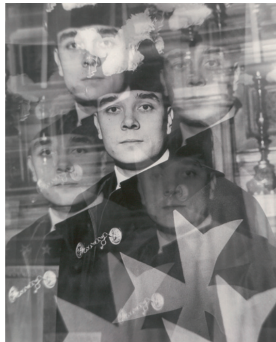
Yehuda Neiman, Yves Klein, 1959 Silbergelatineabzug / Gelatin silver print, Sammlung Würth, Inv. 19391

Andy Warhol, from Pablo Picasso to Niki de Saint Phalle and Frank Stella. And from René Burri, Robert Capa, Philippe Halsman, Lee Miller and Man Ray to Robert Mapplethorpe, Helmut Newton, Albert Watson and Charles Wilp. Amounting to more than 200 works, this gallery additionally records how masterfully this still young medium with its artistically and technically diverse visual language emancipated itself in the course of the 20th century into an autonomous art form. The intrinsically photographic process of shooting and developing has long since expanded far beyond its technically determined connotations. In many of their works, the photographers meet their opposite numbers (from their own genre) at eye level. Many images have a documentary look