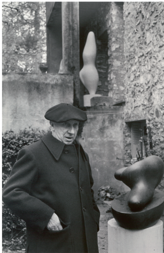
Ingeborg „Inge“ Morath, Hans Arp), vor seiner Bronze Kleine Venus von Meudon / Hans Arp, standing in front of his bronze Little Venus of Meudon, 1956 (2000) Silbergelatineabzug / Gelatin silver print, Sammlung Würth, Inv. 19371