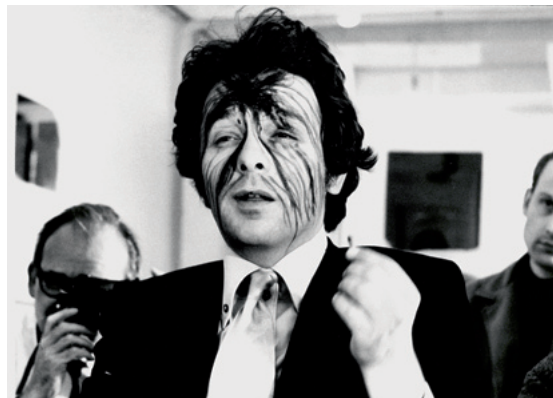
Stefan Moses, Arnulf Rainer, 1967 (1994) Silbergelatineabzug / Gelatin silver print Sammlung Würth, Inv. 19382

Anhand eines fabelhaften „Who's who“ entführt die Bildnisgalerie, die sich auf Porträts in der Sammlung Würth vertretener Künstlerinnen und Künstler konzentriert, in einen Parnass der Kunst des 20. Jahrhunderts. Sowohl, was die Porträtierten, als auch, was die Genies hinter der Kamera betrifft. Von Max Beckmann und Georges Braque bis Andy Warhol, von Pablo Picasso oder Niki de Saint Phalle bis Frank Stella. Und von René Burri, Robert Capa, Philippe Halsman, Lee Miller oder Man Ray bis zu Robert Mapplethorpe, Helmut Newton, Albert Watson oder Charles Wilp. Mit über 200 Werken dokumentiert